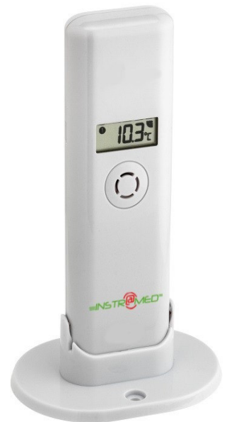
CAPTEUR TEMPERATURE/HYGROMETRIE INST-0202